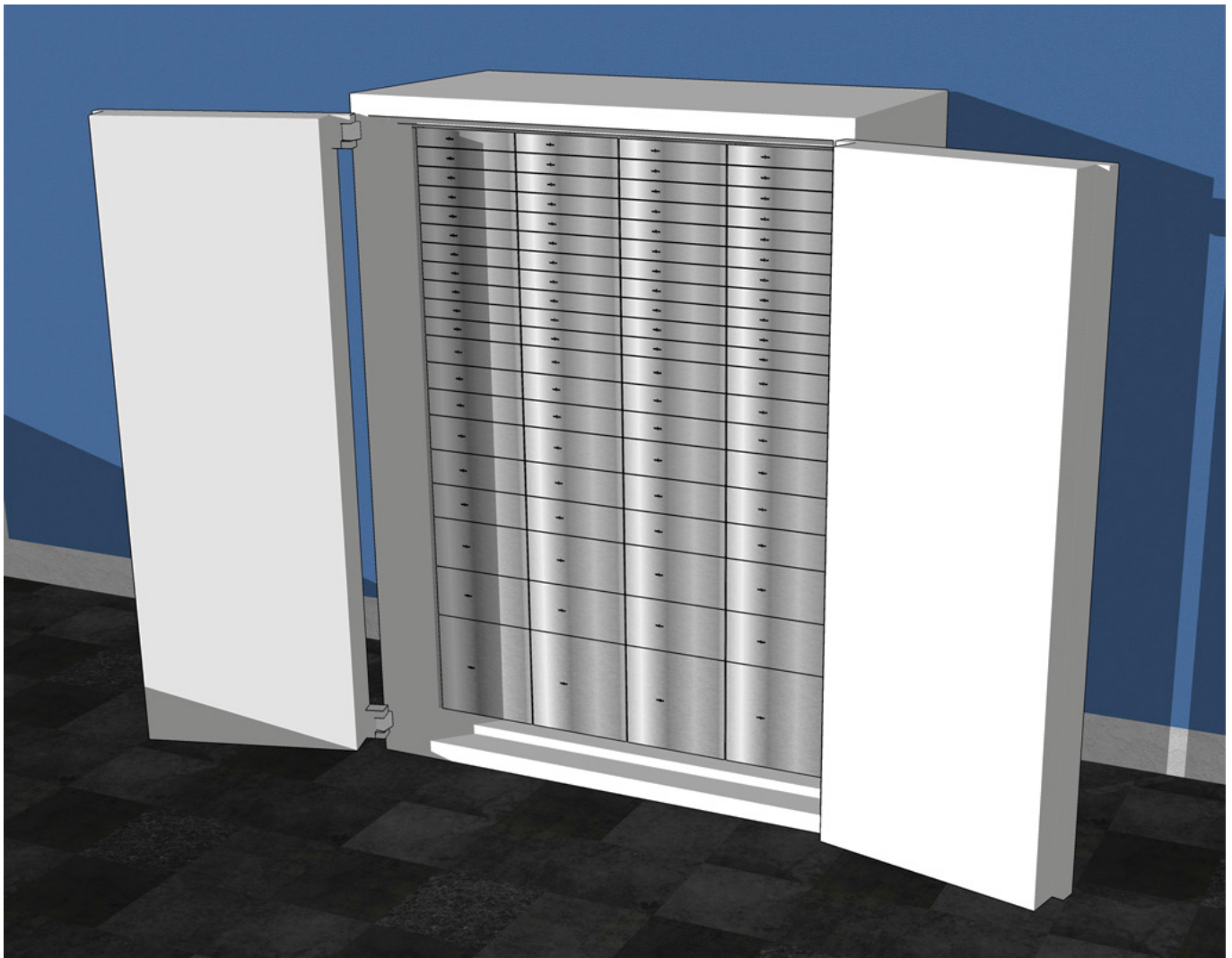
Abbildung: Konstruktionszeichnung einer Mietfachanlage in einem Wertschutzschrank