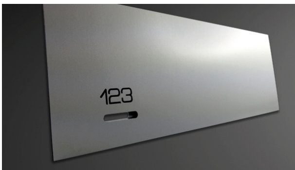
Aluminium natur, Fachnummern graviert