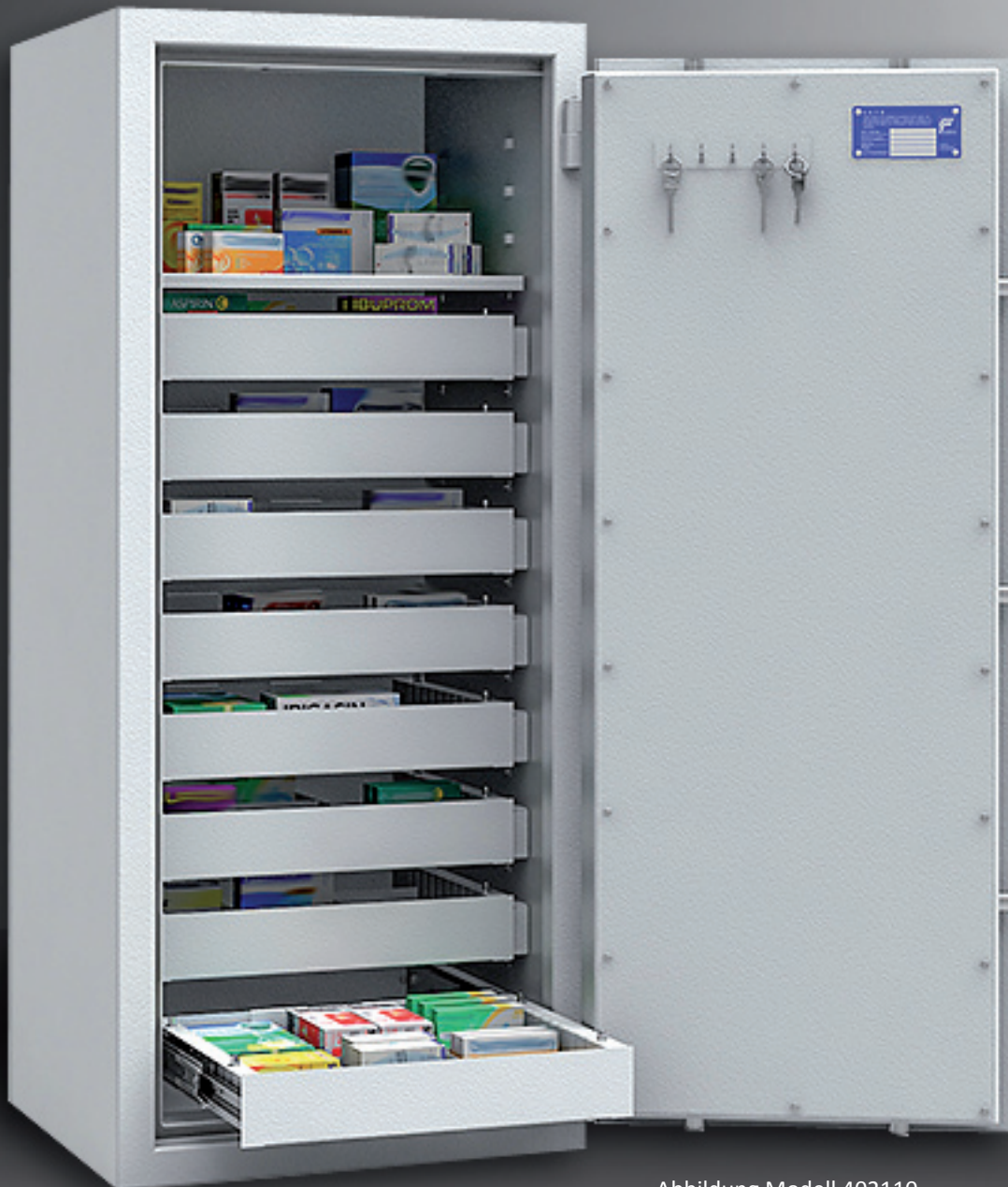
Abbildung Modell 402110