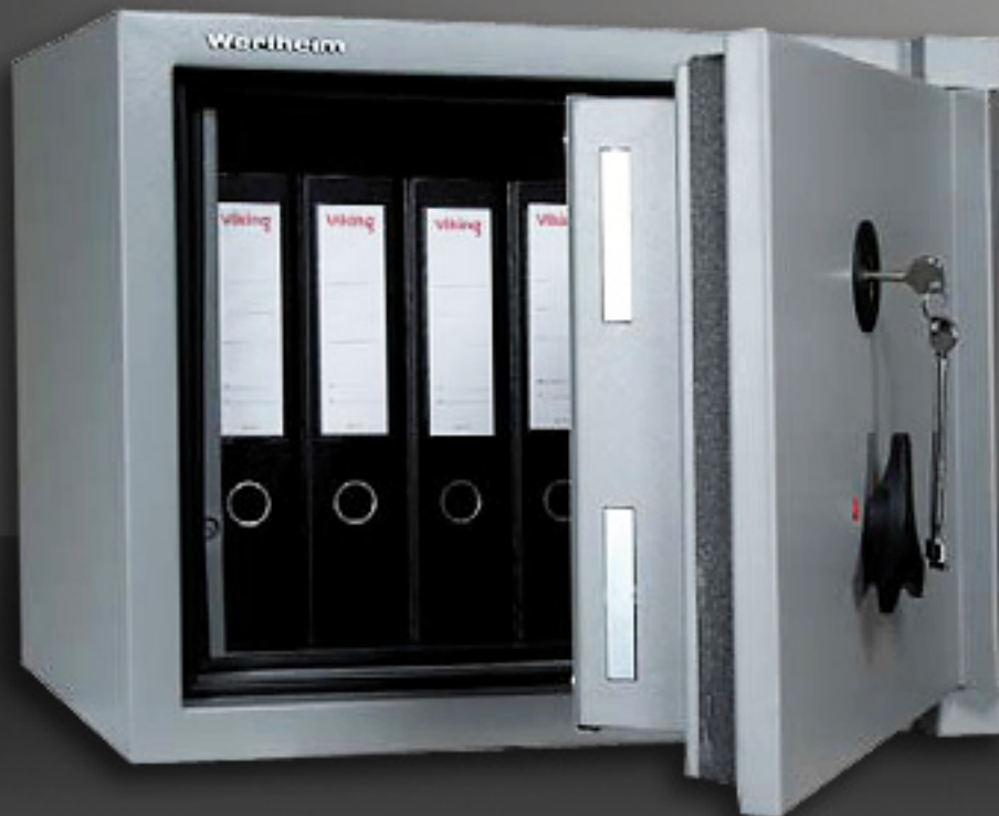
Abbildung: Modell AM10 mit Brandschutz Klasse LFS 60 P