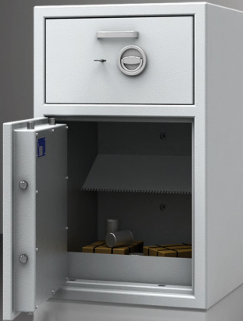
Abbildung: Modell mit Türanschlag DIN links (optional)