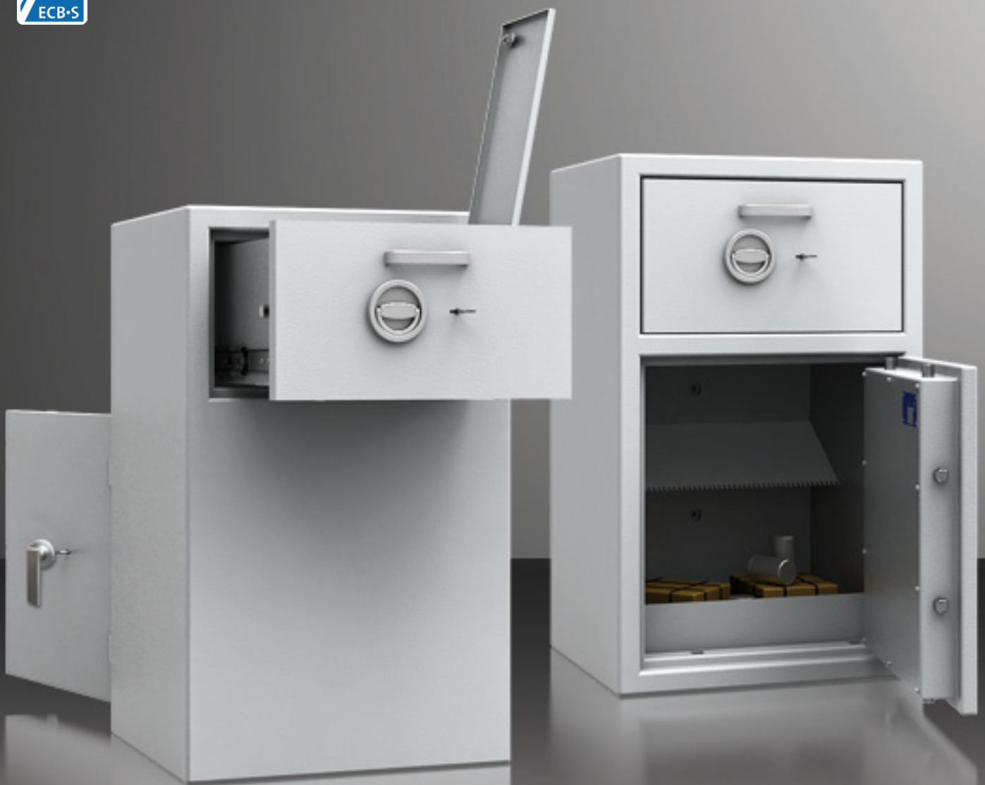
Abbildung links: Modell mit rückseitiger Einwurfschublade