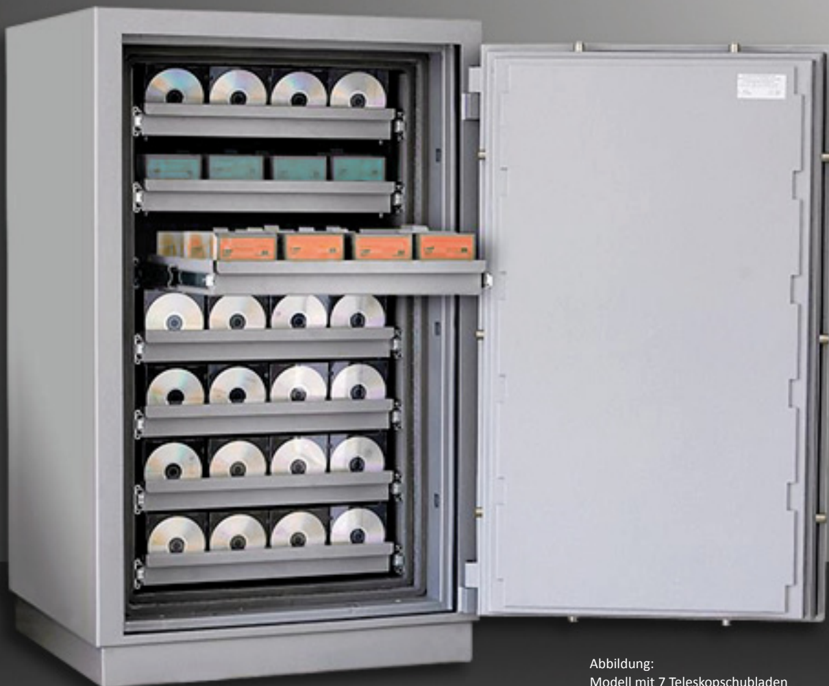
Abbildung: Modell mit 7 Teleskopschubladen (optional gegen Mehrpreis)