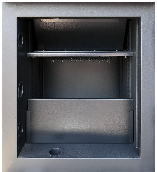
Innentresorraum mit vertikaler Trennwand