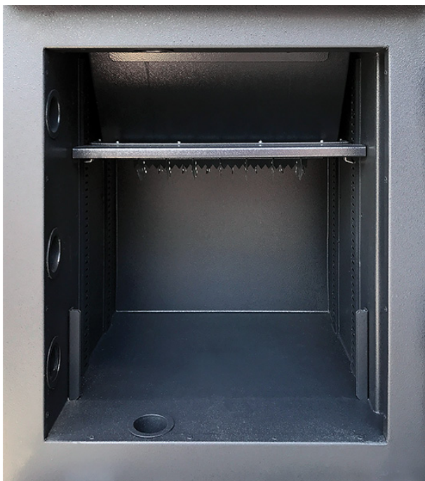
Innentresorraum ohne vertikale Trennwand