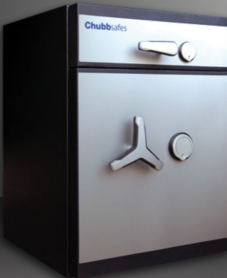
Abbildung: Modell Chubbsafes ProGuard DT II 60