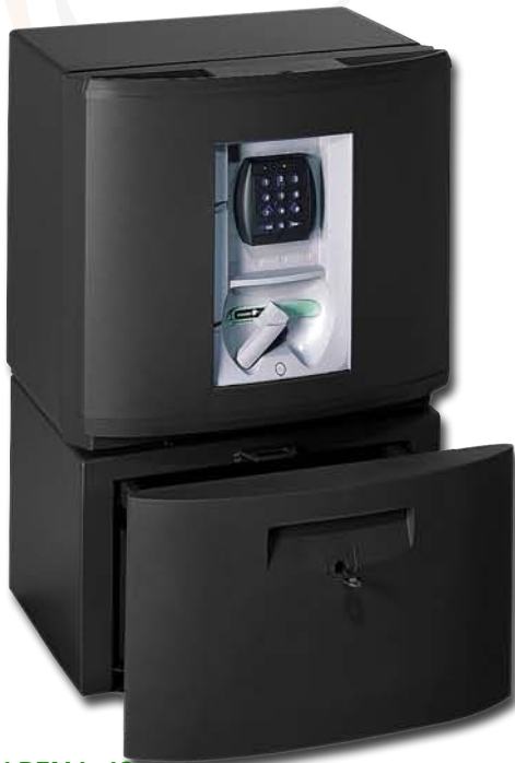
CARENA 40 mit Unterbau-Sockel (optional)

Er bietet eine Vielzahl an Sicherheitseigenschaften zum Schutz Ihrer Wertgegenstände gegen Diebstahl. Der Carena LifeStyle ist in sechs Größen mit einem Volumen von 40-370 L verfügbar